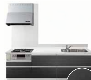
No.2 FPD (木目柄マット調)