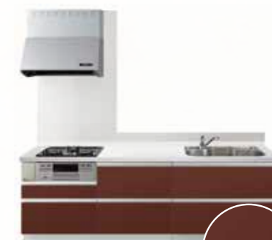
No.3 FPM (木目柄マット調)