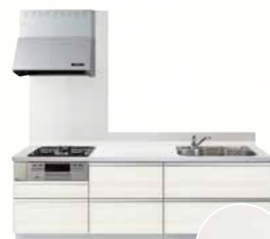
No.1 HSN (木目調艶有り)