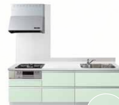
No.4 HNM (抽象柄艶有り)