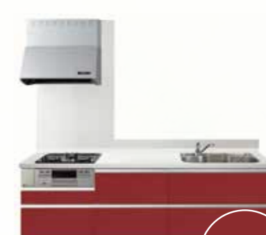
No.6 HNC (抽象柄艶有り)