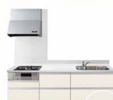
No.5 FPW (木目柄マット調)