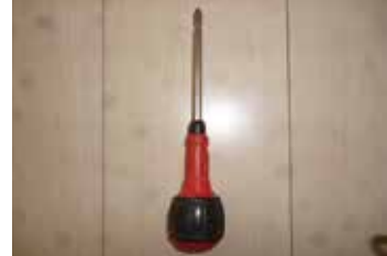
プラスドライバー