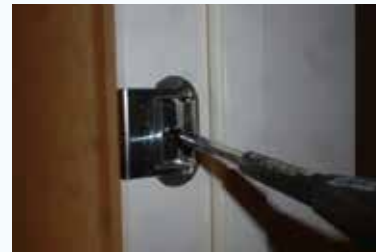
③ネジを固定する。再度開閉の確認を行う。変化がないときは①の手順にもどる。