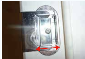
②ラッチの中の金属部分が写真の矢印方向にスライドするので間隔を調整する