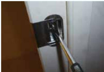
①ラッチのネジ部分を緩める