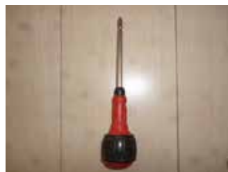
プラスドライバー